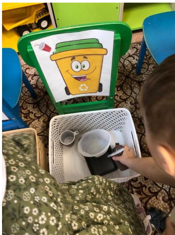
Дети средней группы показали, как они заботятся о чистоте нашей природы.